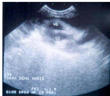
Imagen ecográfica de un derrame pleural en un gato; hay una pérdida de definición y se aprecia el líquido libre en la cavidad pleural.

La prueba más importante para el diagnóstico y el tratamiento es la toracocentesis que permite vaciar la cavidad torácica de líquido, mejorar y estabilizar la